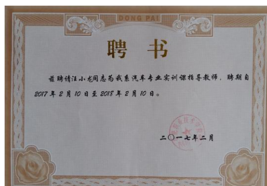
聘请校外兼职教师部分聘书