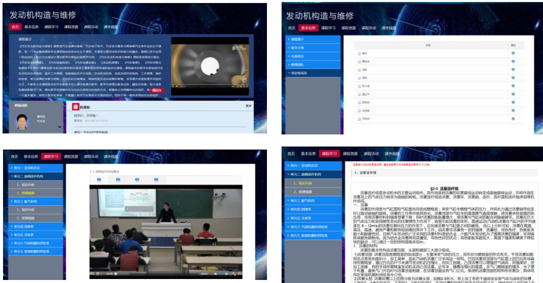
省级精品资源共享课程网页