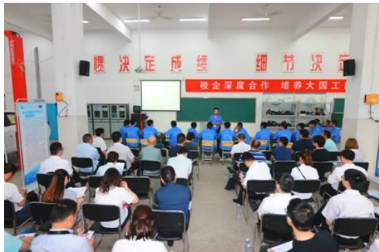
与上汽通用等企业开展深度校企合作