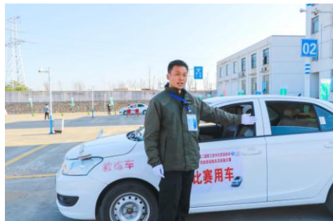
承担全省职工技术大比武竞赛活动

8、巢湖监狱内设立的汽车项目校外教学点挂牌，完成了教学设备购置、培训计划设计等工作。首批为监狱内改造人员提供汽车专业（30 人）与机械加工专业（30 人）培训和职业技能鉴定。