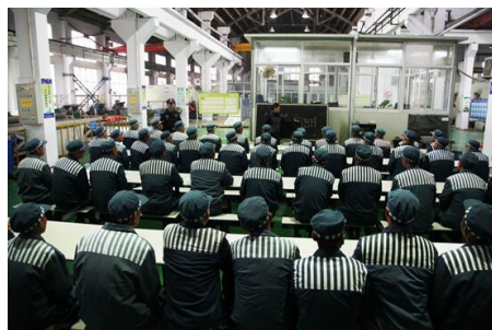
巢湖监狱教学点揭牌仪式及教学场景